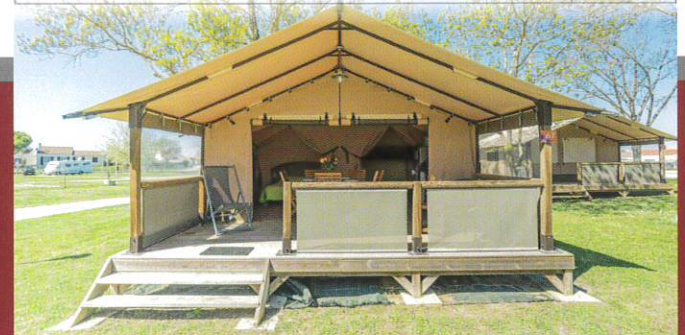
O'hara 6 personnes - 30 m 2 3 chambres