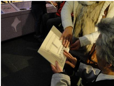
Une maquette thermogonflée permet de mieux « visualiser »

Une visite sensorielle gratuite du musée de l'île d'Oléron a eu lieu. Une dizaine de personnes y ont abordé les différentes collections du musée (modes de vie et activités traditionnels) à partir d'expériences