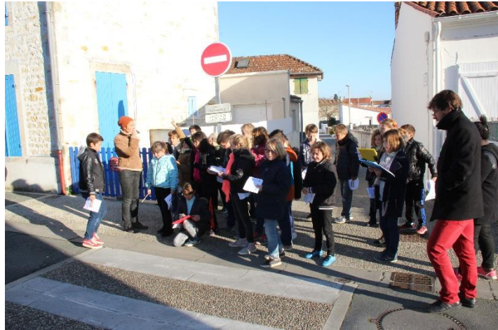
Ce passage piéton à Saint-Trojan-les-Bains est-il accessible ?

Les classes étaient accompagnées par un ou plusieurs élus de la commune et un agent des services techniques. Les échanges ont été nourris et constructifs et peut-être mèneront-ils vers de futurs aménagements en faveur des personnes en situation de handicap ?