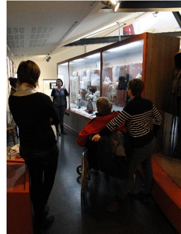
Le musée de l'île d'Oléron est accessible à tous

tactiles, olfactives ou encore d'ambiances sonores. Pour rappel, le musée de l'île d'Oléron est labellisé « Tourisme et Handicap ». Il ne faut donc pas hésiter, quel que soit son handicap ou son âge à venir découvrir ce lieu adapté pour tous !