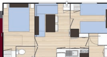
O'hara 4 personnes - 27 m 2 2 chambres