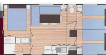
O'hara 6 personnes - 30 m 2 3 chambres